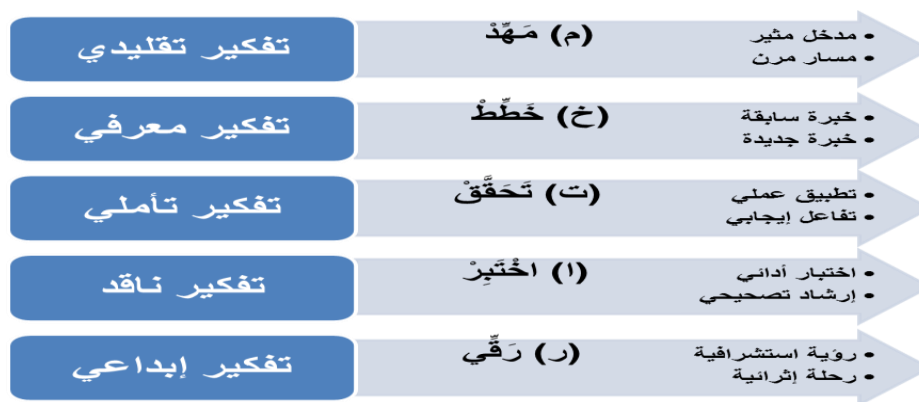
الشكل (٣) علاقة نموذج مختار التدريبي بأشكال التفكير المختلفة

ويوضح الشكل (٣) استناد نموذج مختار التدريبي المقترح إلى التفكير الشامل في جميع مراحل وخطواته بما يترجم أفكار أصحاب المذهب البنائي.